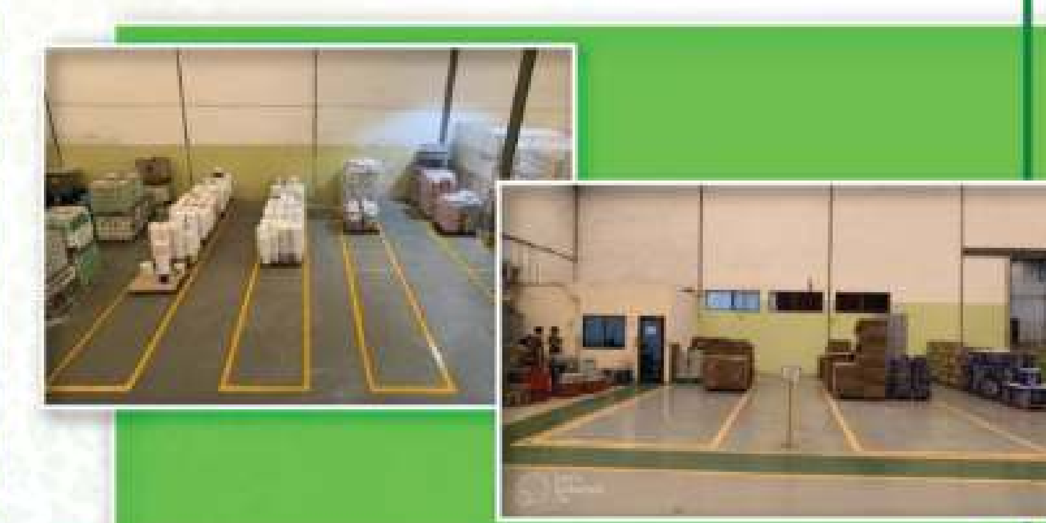
Yellow Line dan Labelling Area RMK

Layout area RMK sudah lebih tertata, adanya marking yellow line area, adanya area reject di RMK, dan yellow line di area RMK dus sudah tertata.