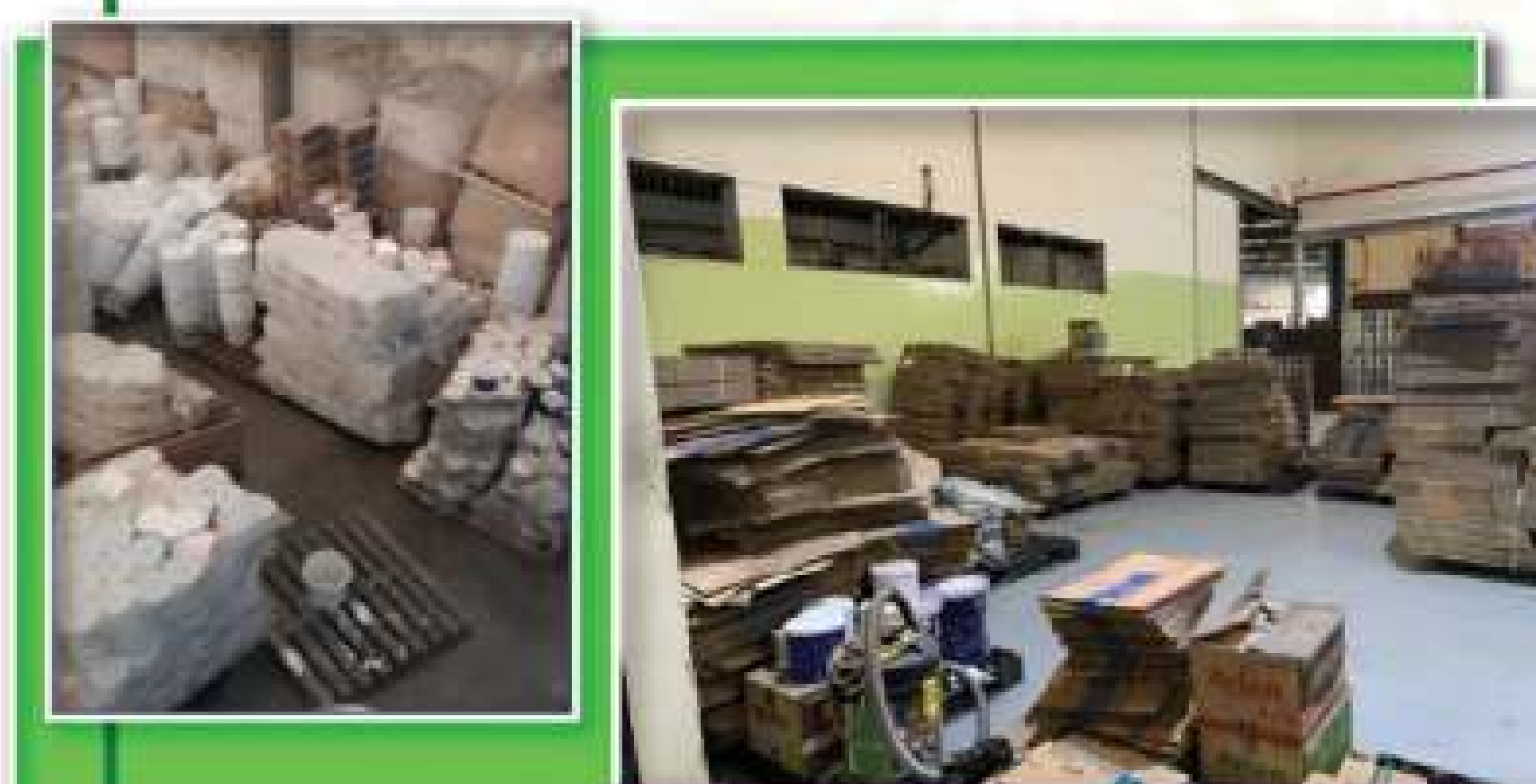
Dus Synthetic & Emulsion tercampur

Layout area RMK belum standart, tidak adanya marking yellow line area, tidak adanya area reject di RMK, dan dus synthetic & emulsion masih tercampur.