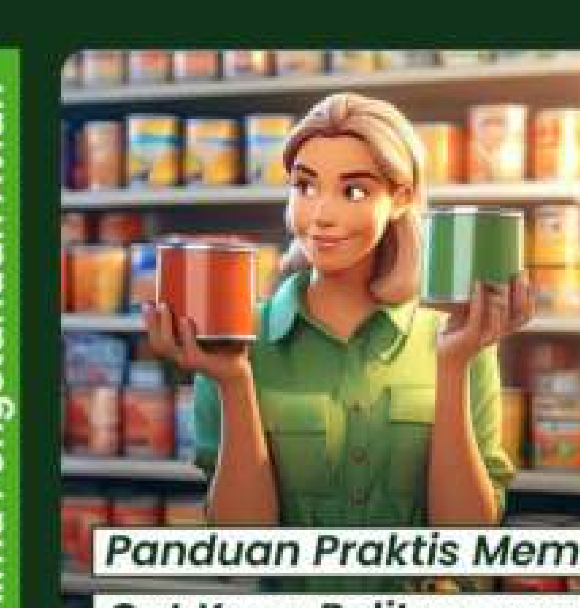
Panduan Praktis Memilih Cat Kayu Politur yang Tepat