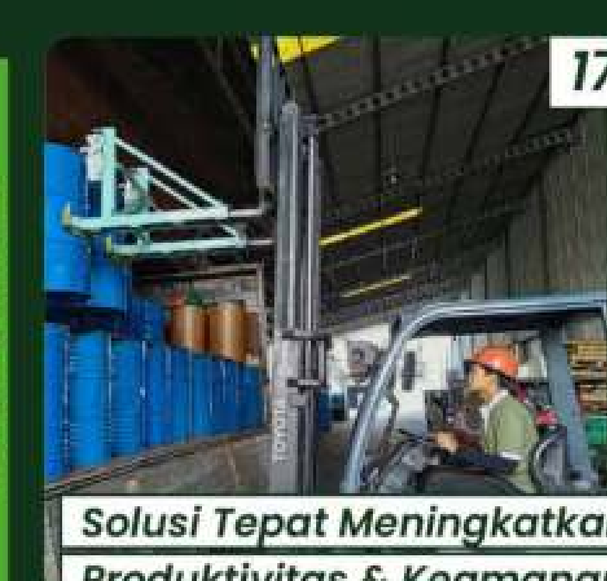
Solusi Tepat Meningkatkan Produktivitas & Keamanan