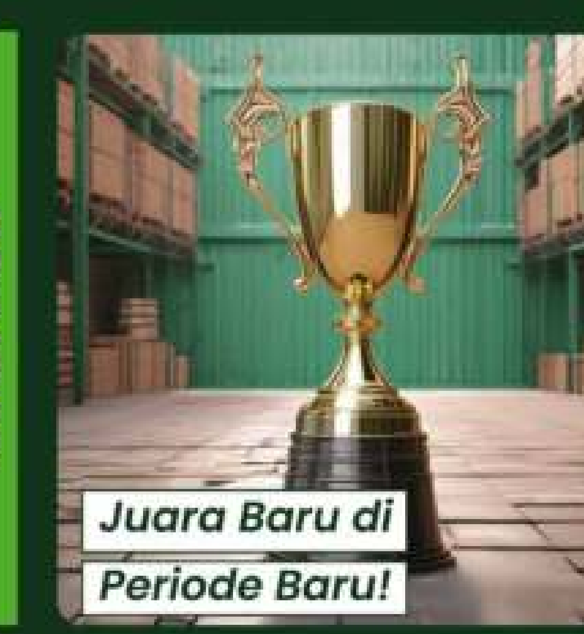
Juara Baru di Periode Baru!