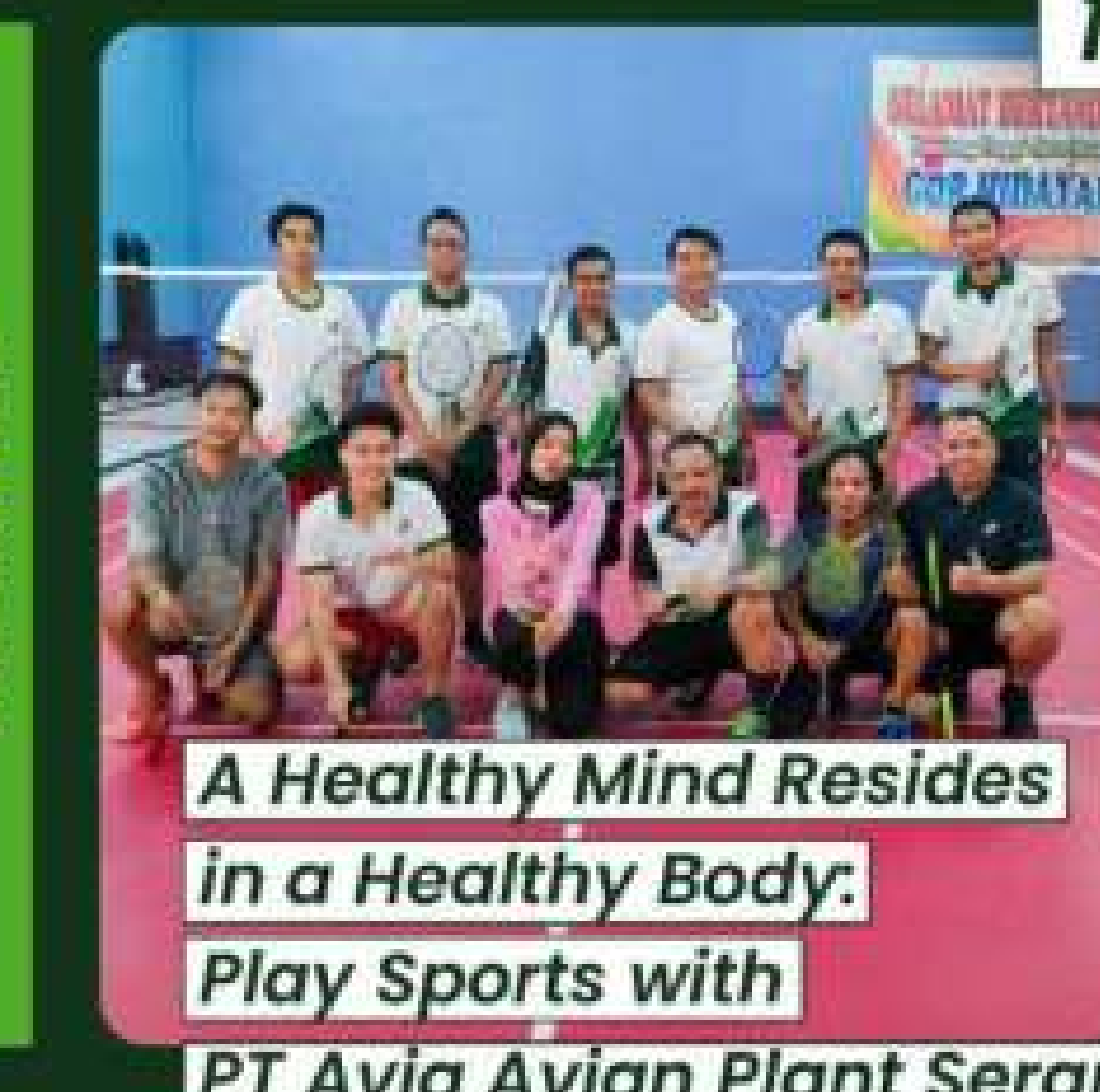
A Healthy Mind Resides in a Healthy Body. Play Sports with PT Avia Avian Plant Serang