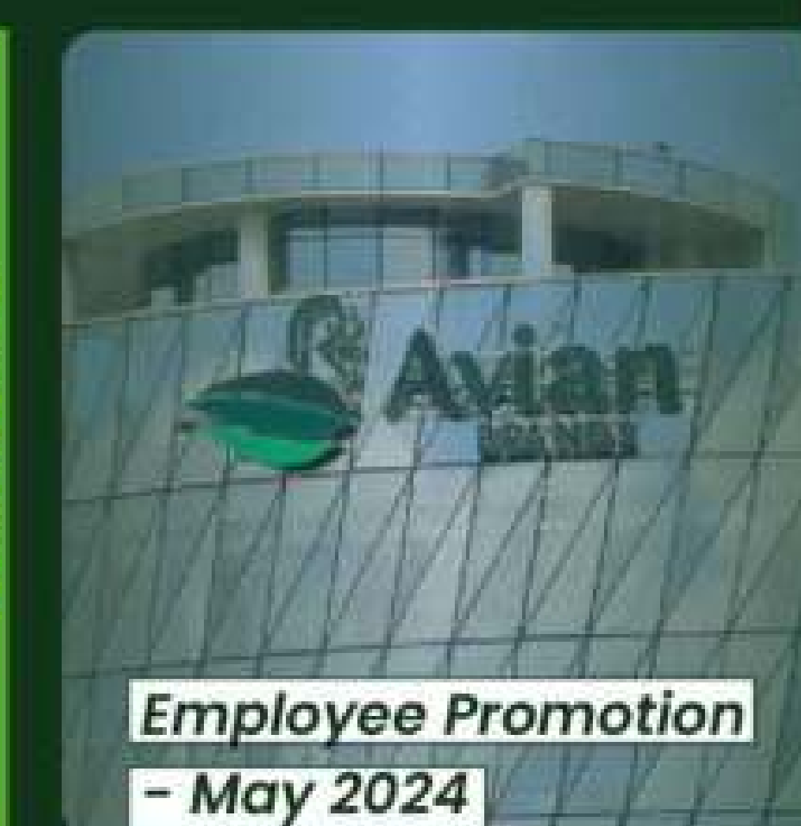
Employee Promotion - May 2024