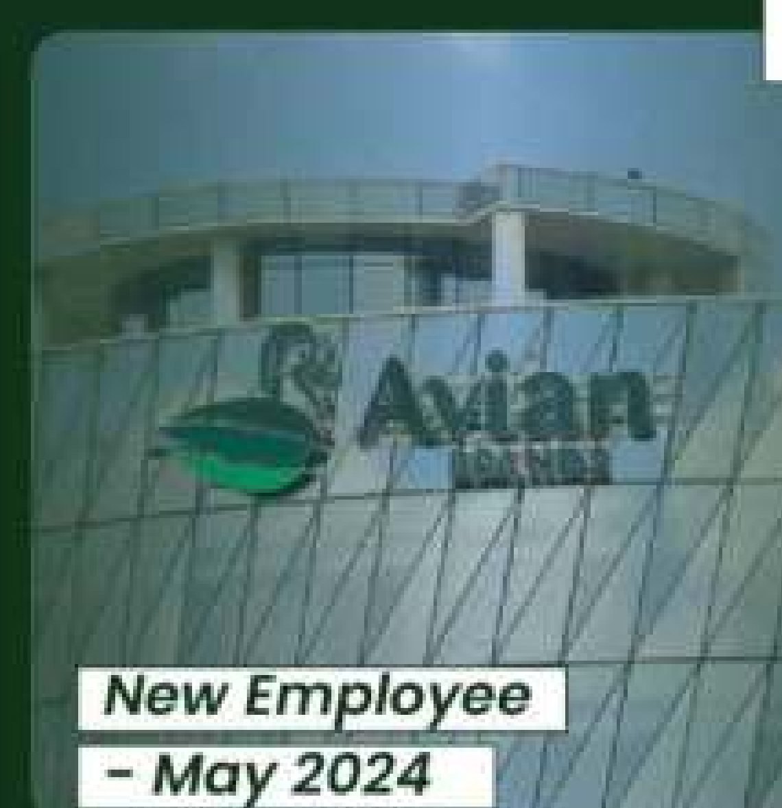
New Employee - May 2024