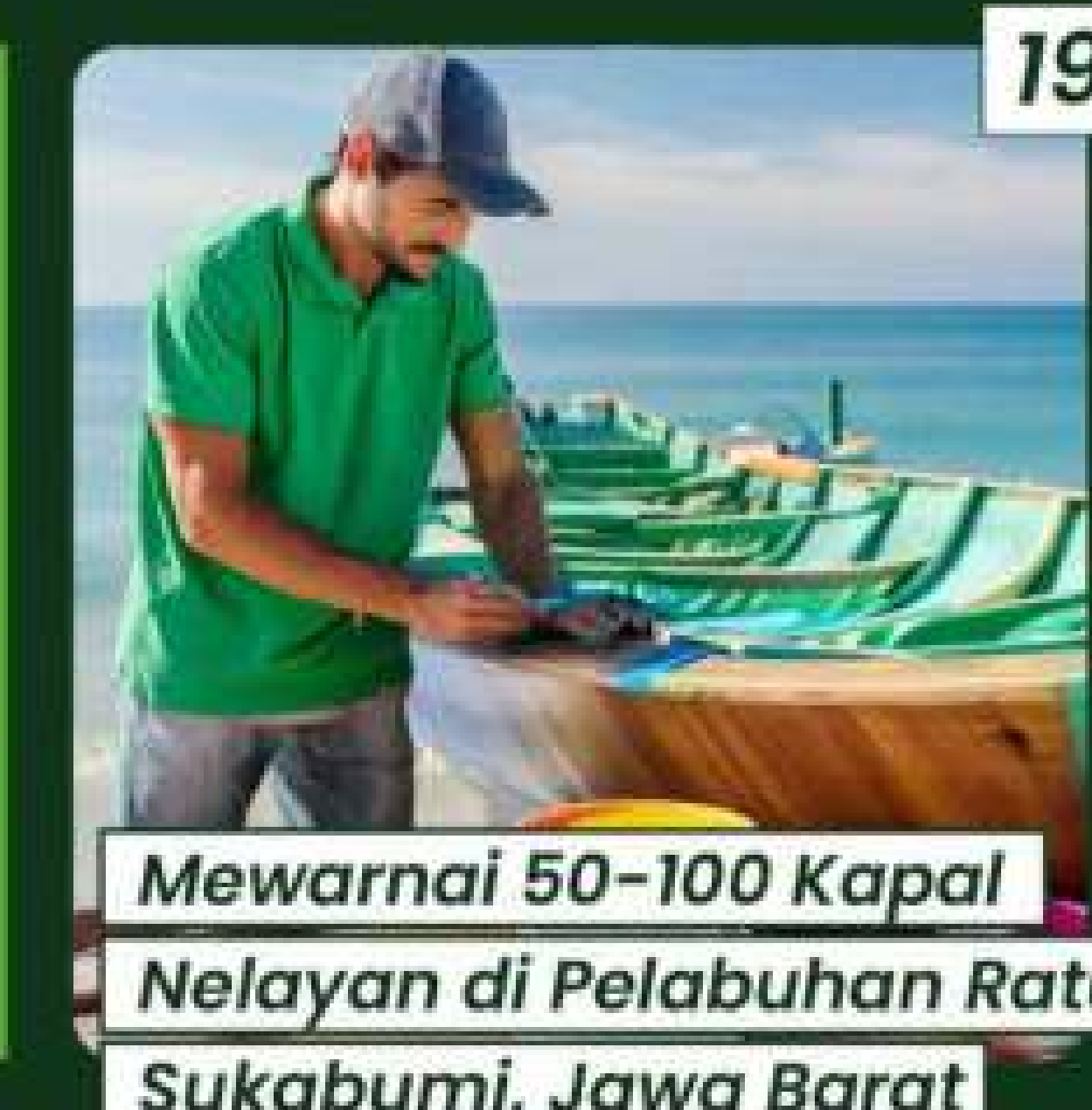
Mewarnai 50-100 Kapal Nelayan di Pelabuhan Ratu, Sukabumi, Jawa Barat