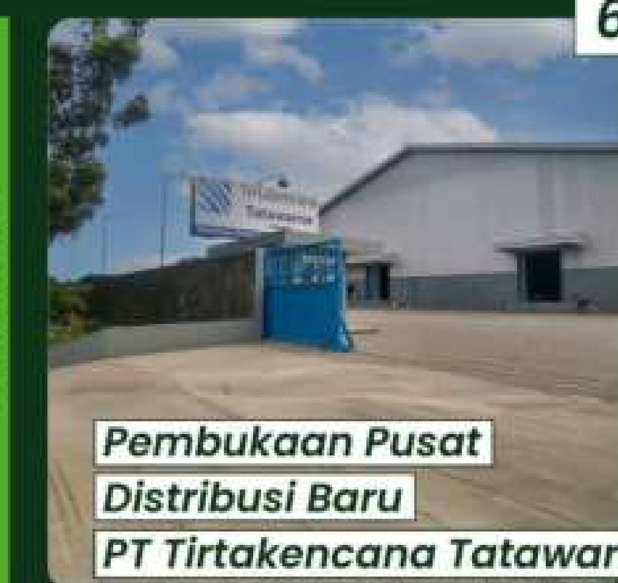
Pembukaan Pusat Distribusi Baru PT Tirtakencana Tatawarna (Member of Avian Brands)