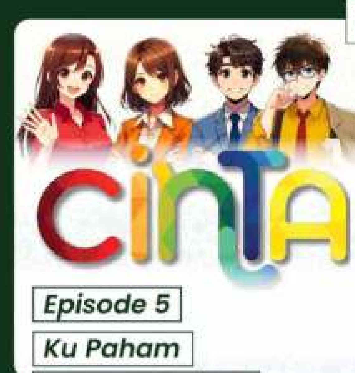
Episode 5 Ku Paham Yang Kau Mau!