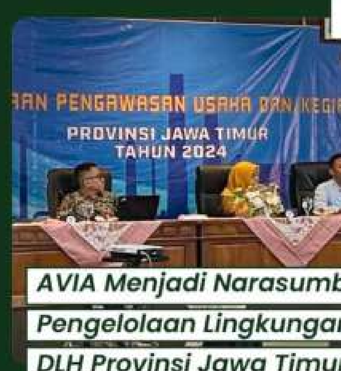
AVIA Menjadi Narasumber Pengelolaan Lingkungan DLH Provinsi Jawa Timur