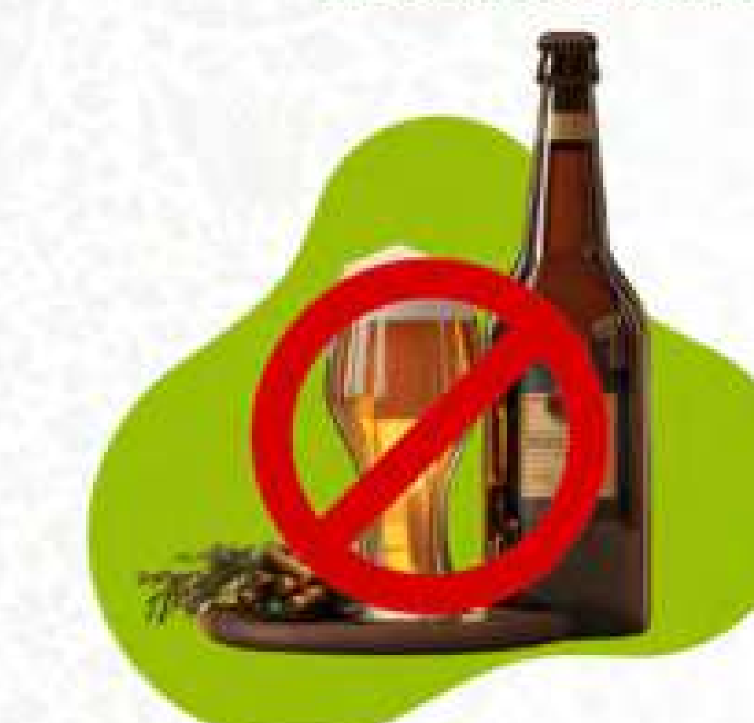
Hindari konsumsi alkohol dan tembakau

Tujuan akhir pengelolaan diabetes adalah meningkatkan kualitas hidup, meningkatkan produktifitas kerja serta menurunkan risiko komplikasi yaitu serangan jantung, penyakit jantung koroner, kebutaan, gagal ginjal, amputasi, stroke hingga kematian. [Elvi]