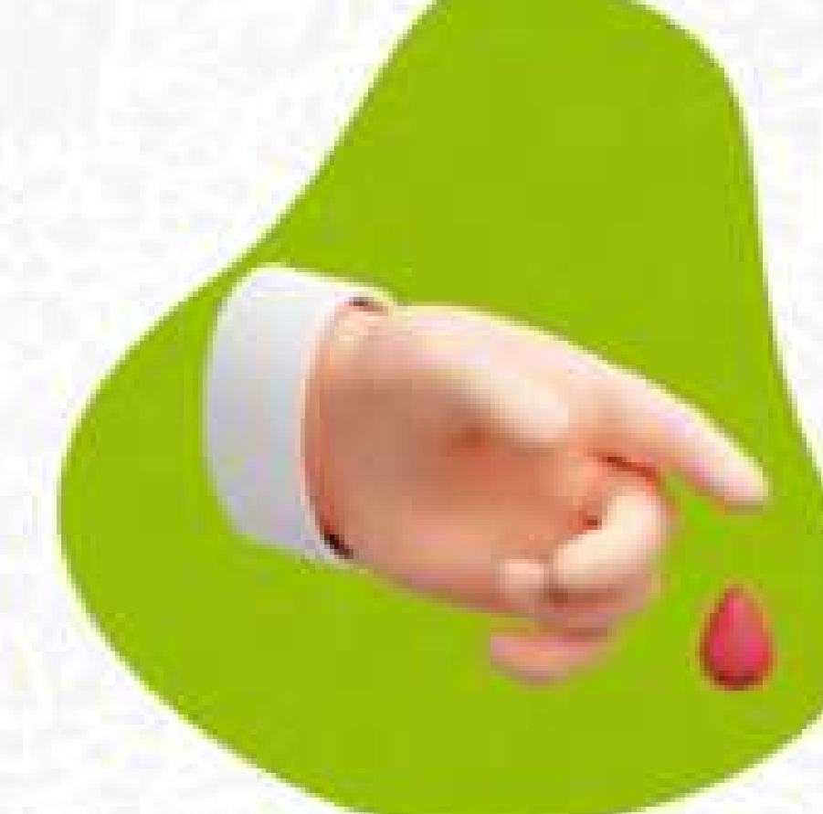
Tes glukosa darah dan HbA1c teratur