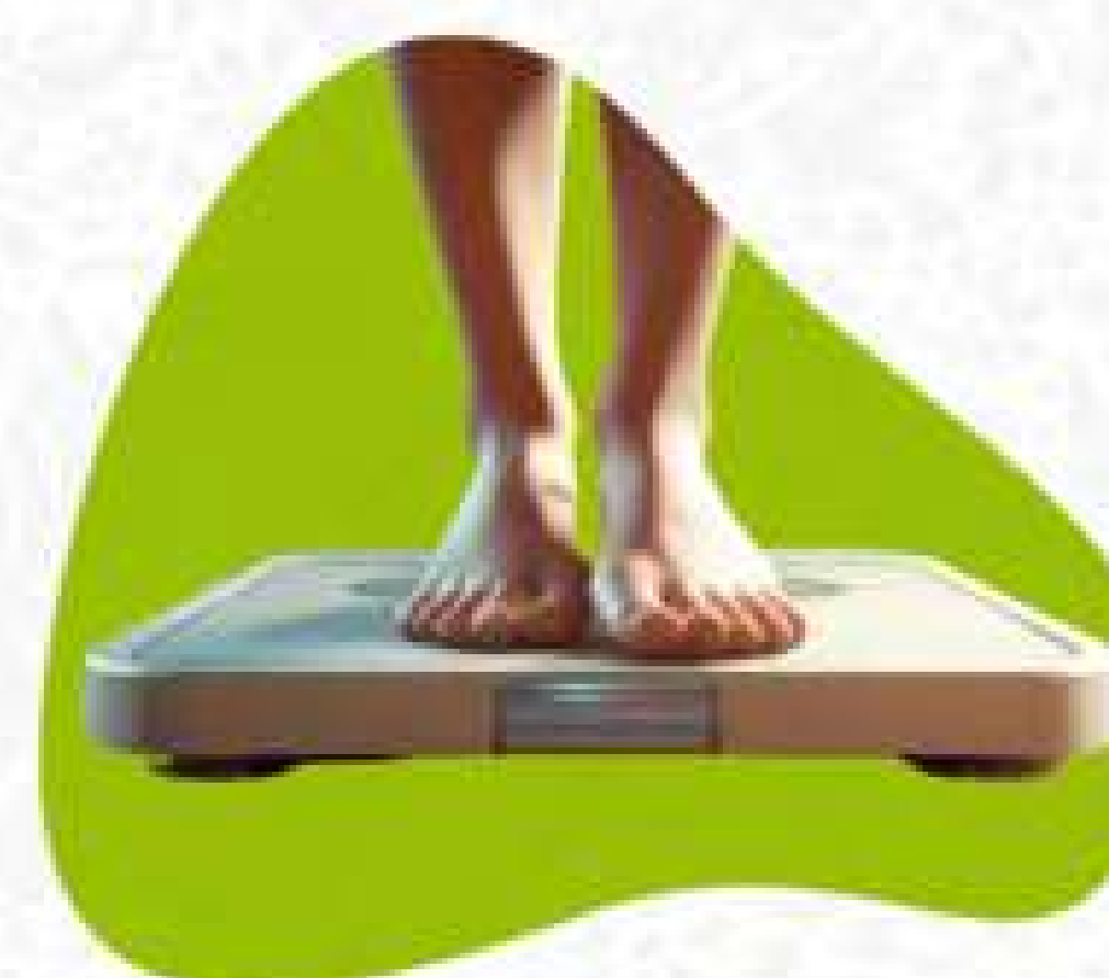
Mempertahankan berat badan ideal