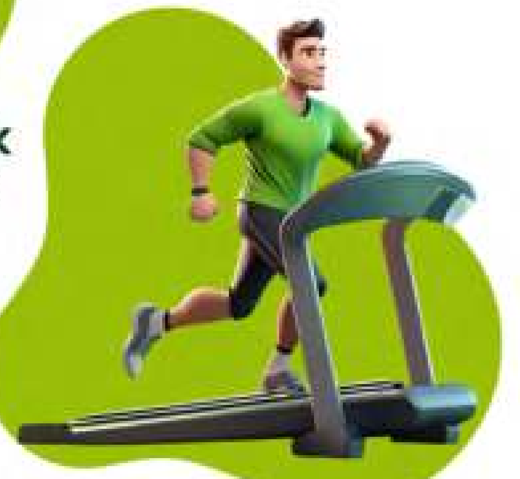
Latihan fisik teratur &amp; tepat dengan Prinsip BBTT (Baik, Benar, Terukur, &amp; Teratur)