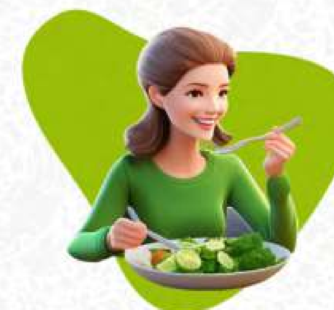
Makan sehat (kurangi lemak, gula, garam)