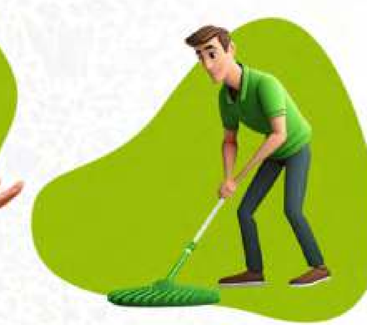
Rutin beraktivitas fisik 30 menit setiap hari