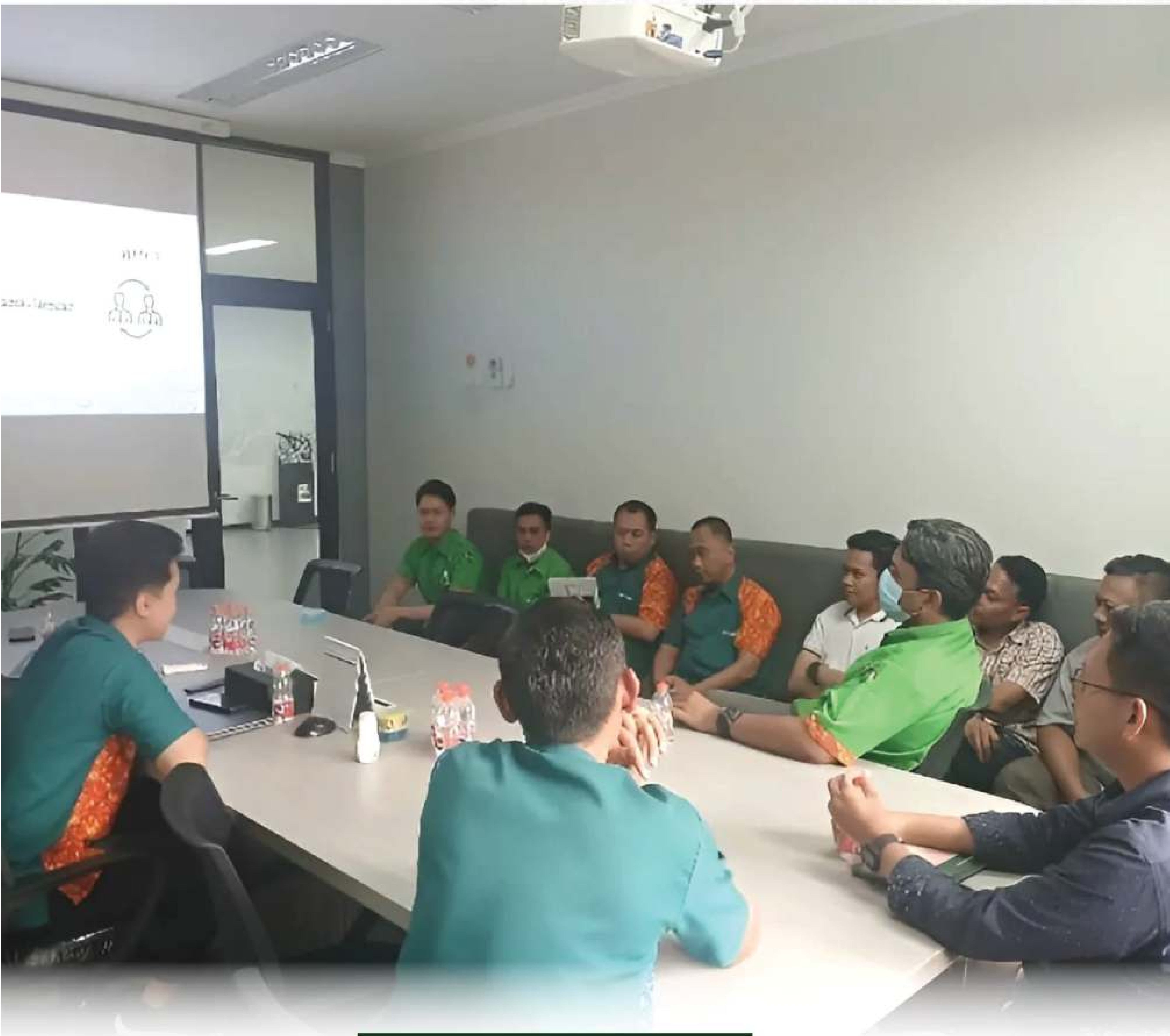
Kegiatan CINTA Avian