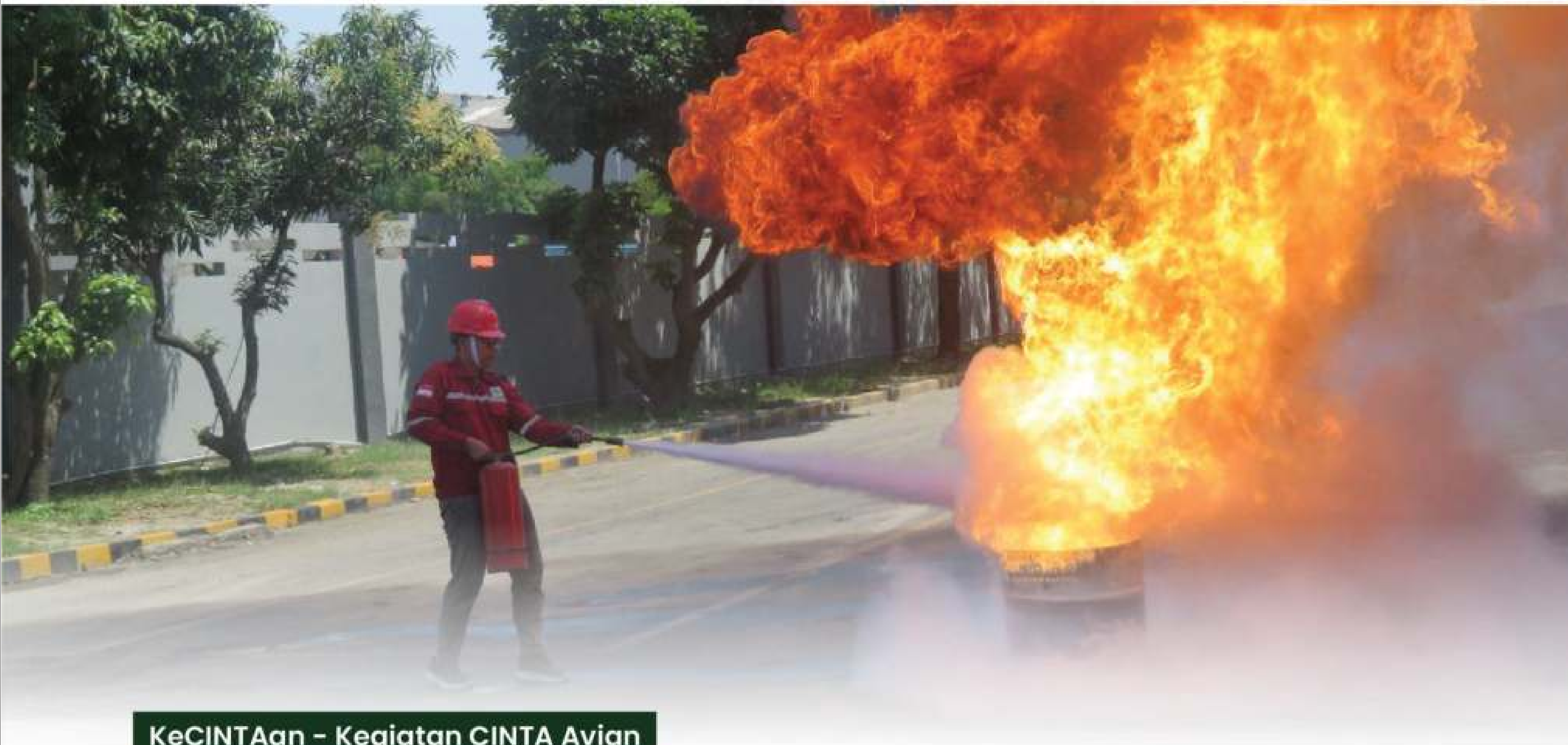
KeCINTAan - Kegiatan CINTA Avian